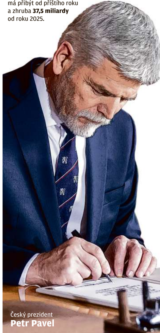
Český prezident Petr Pavel

■ Příjmy státního rozpočtu se mají zvýšit o téměř 70 miliard . Necelých 32 miliard má přibýt od příštího roku a zhruba 37,5 miliardy od roku 2025.