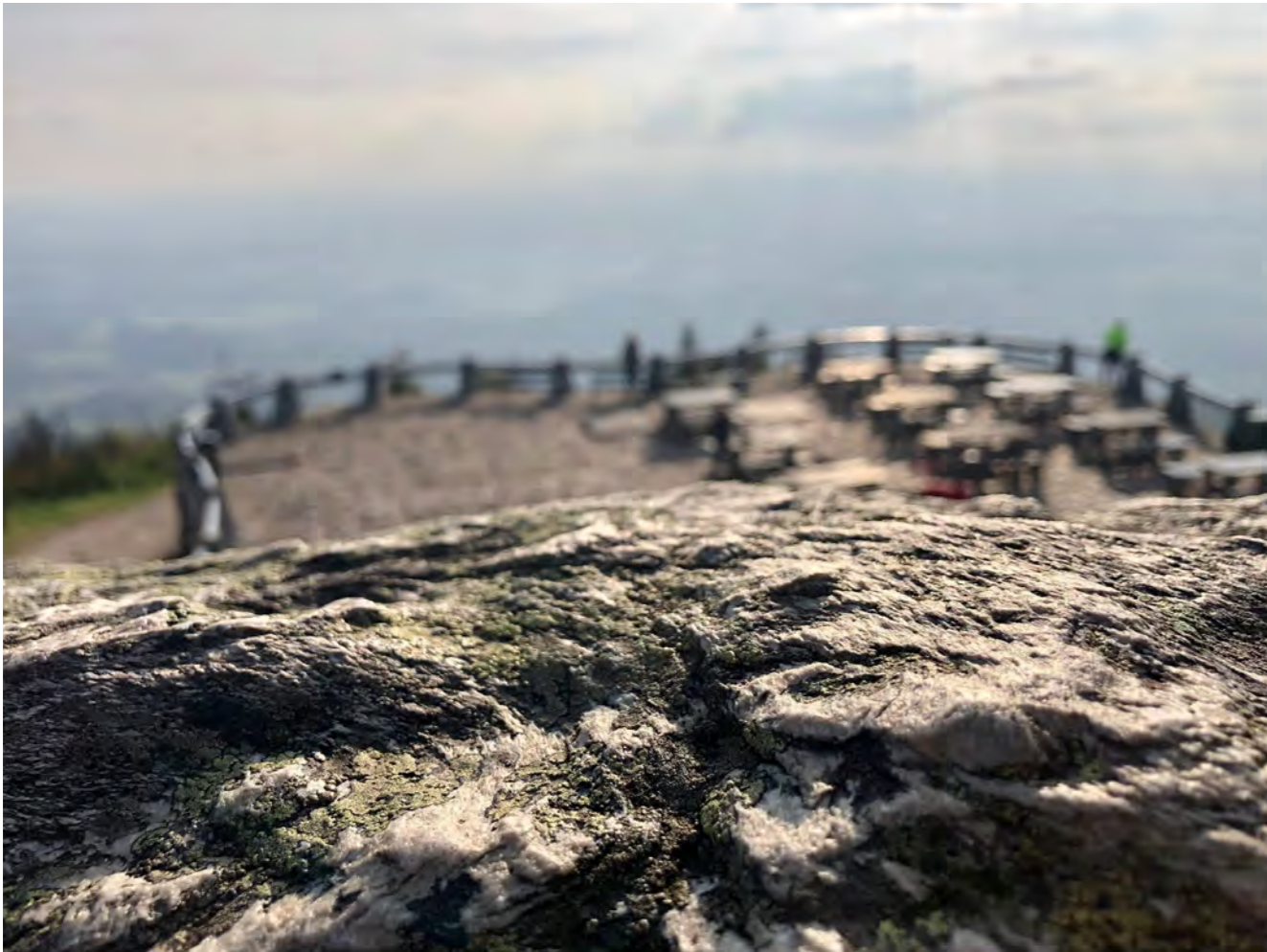
Výlet na Ještěd