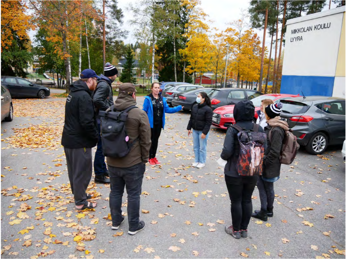
Centrum pro mladistvé ve Vantaa