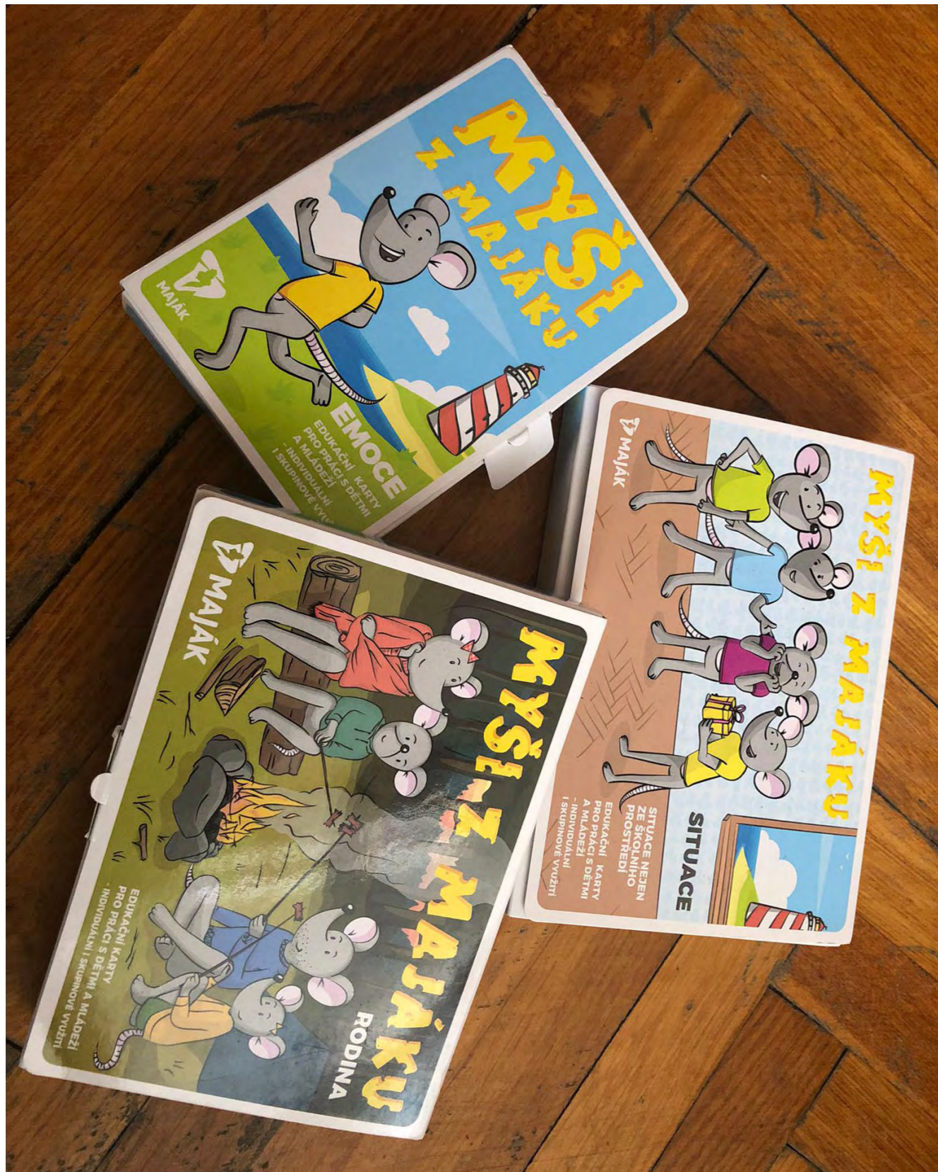
Karty Myši z Majáku