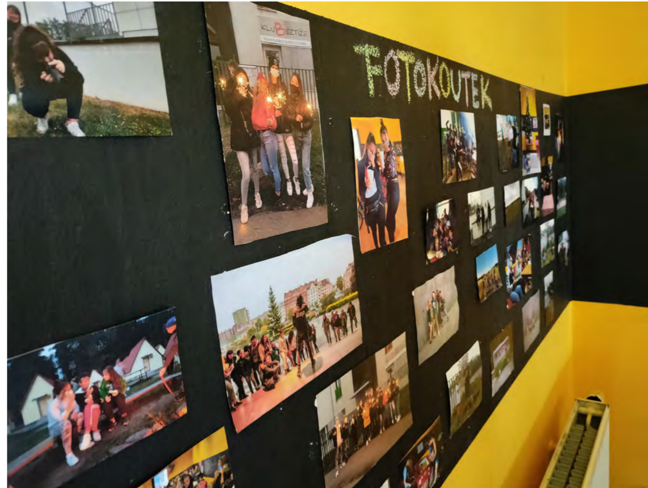
Autobus – Fotbal pro rozvoj