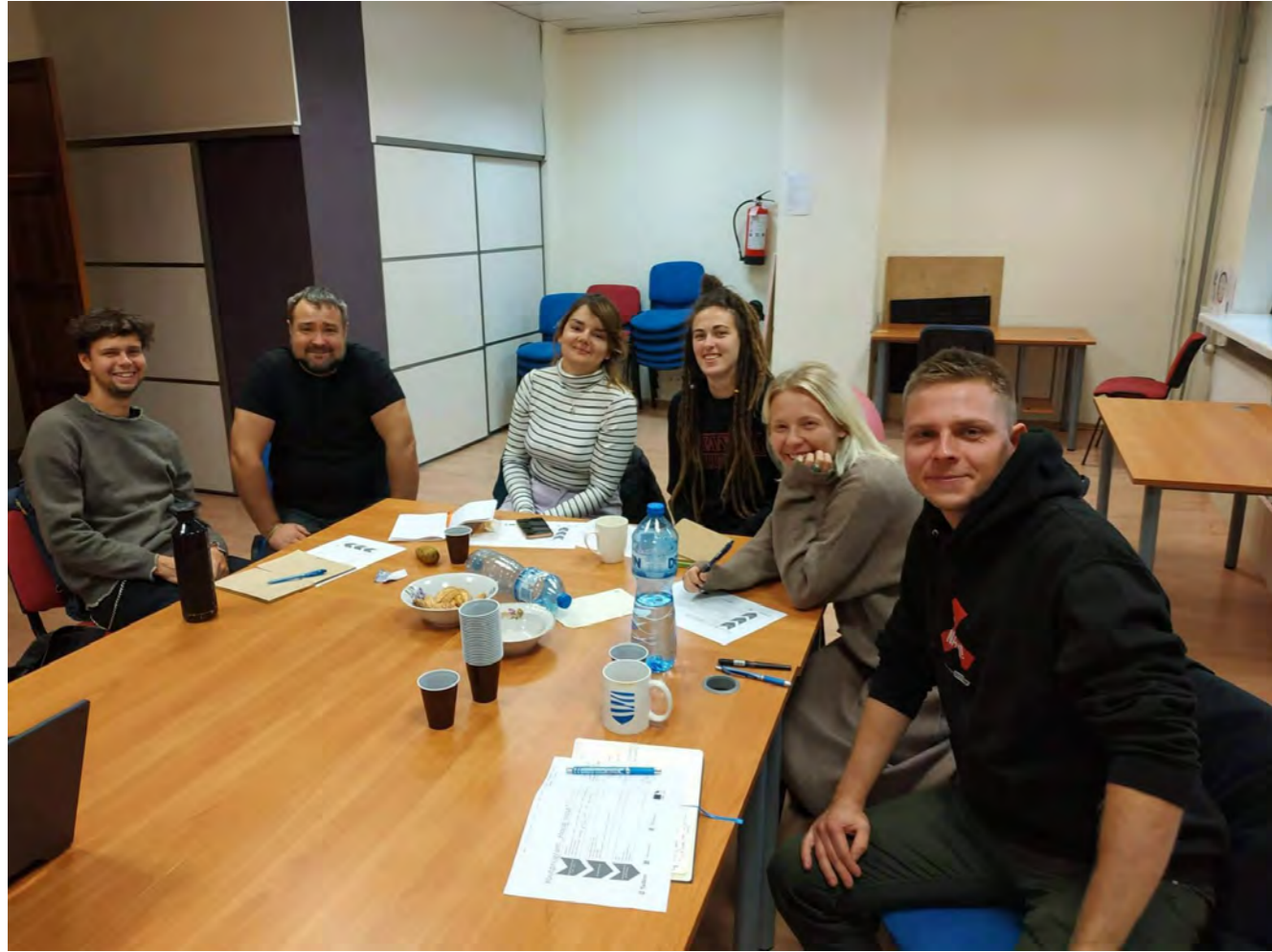
Komunitní policisté v Tallinnu