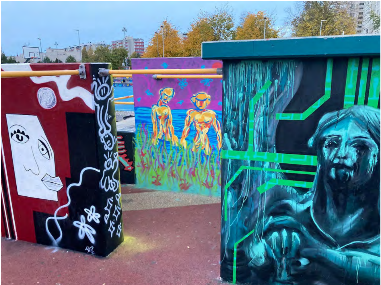
Sídliště v Tallinnu