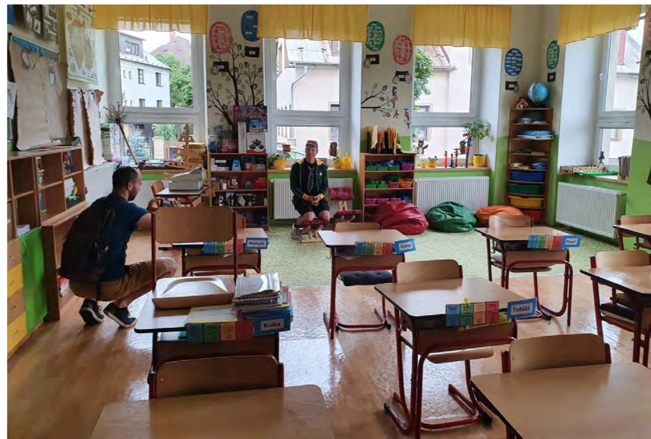
SVČ Narnie, komunitní škola, volnočasové kluby