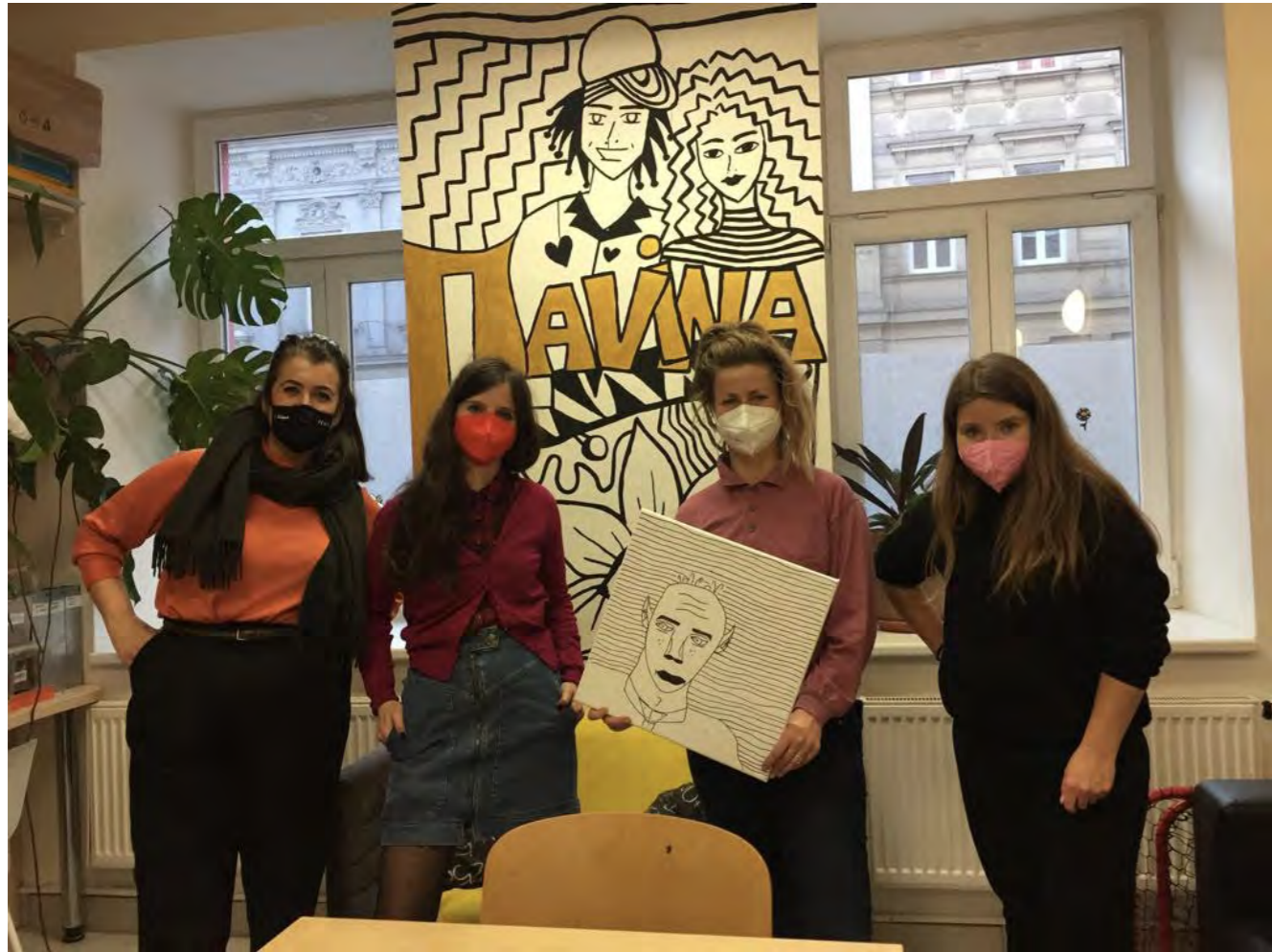
Brno, Klub Lavina