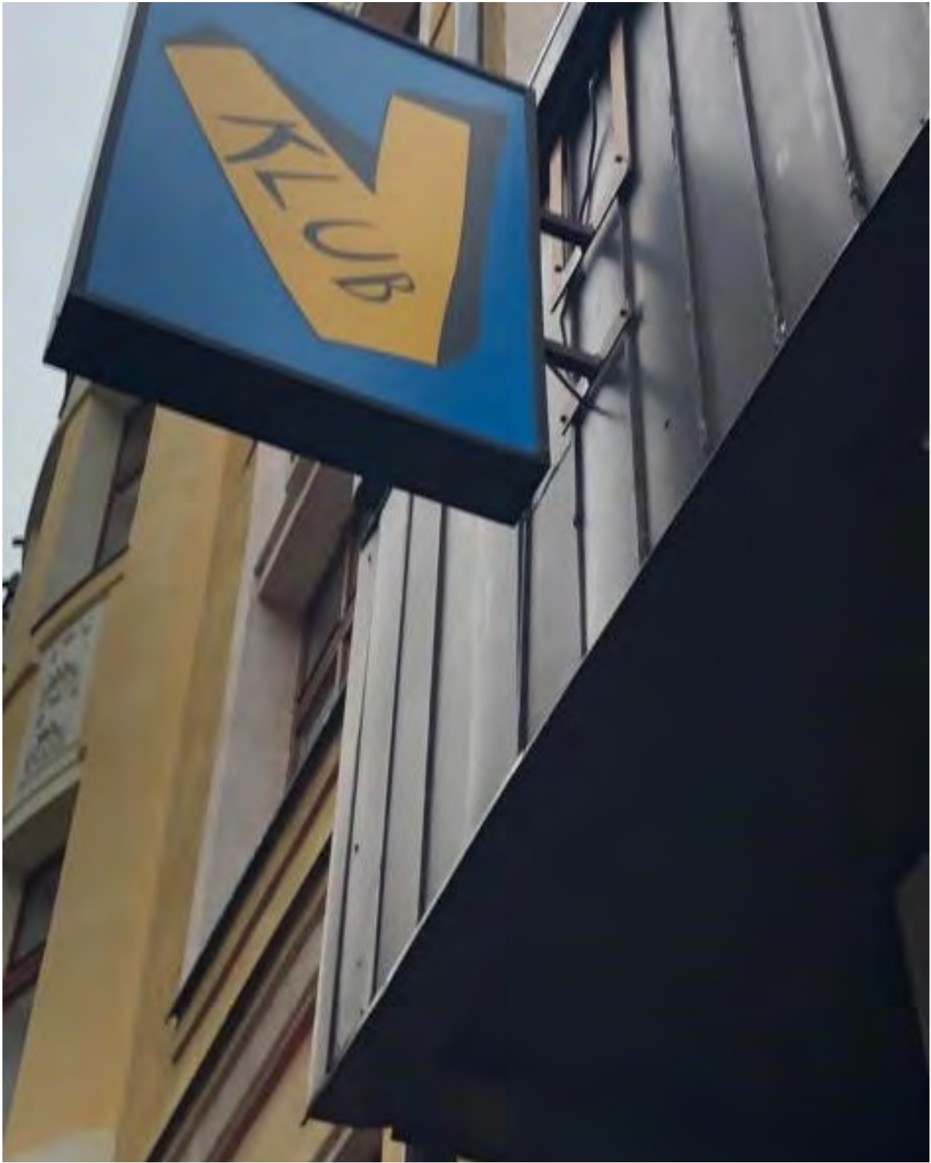
DDM Větrník a V-klub