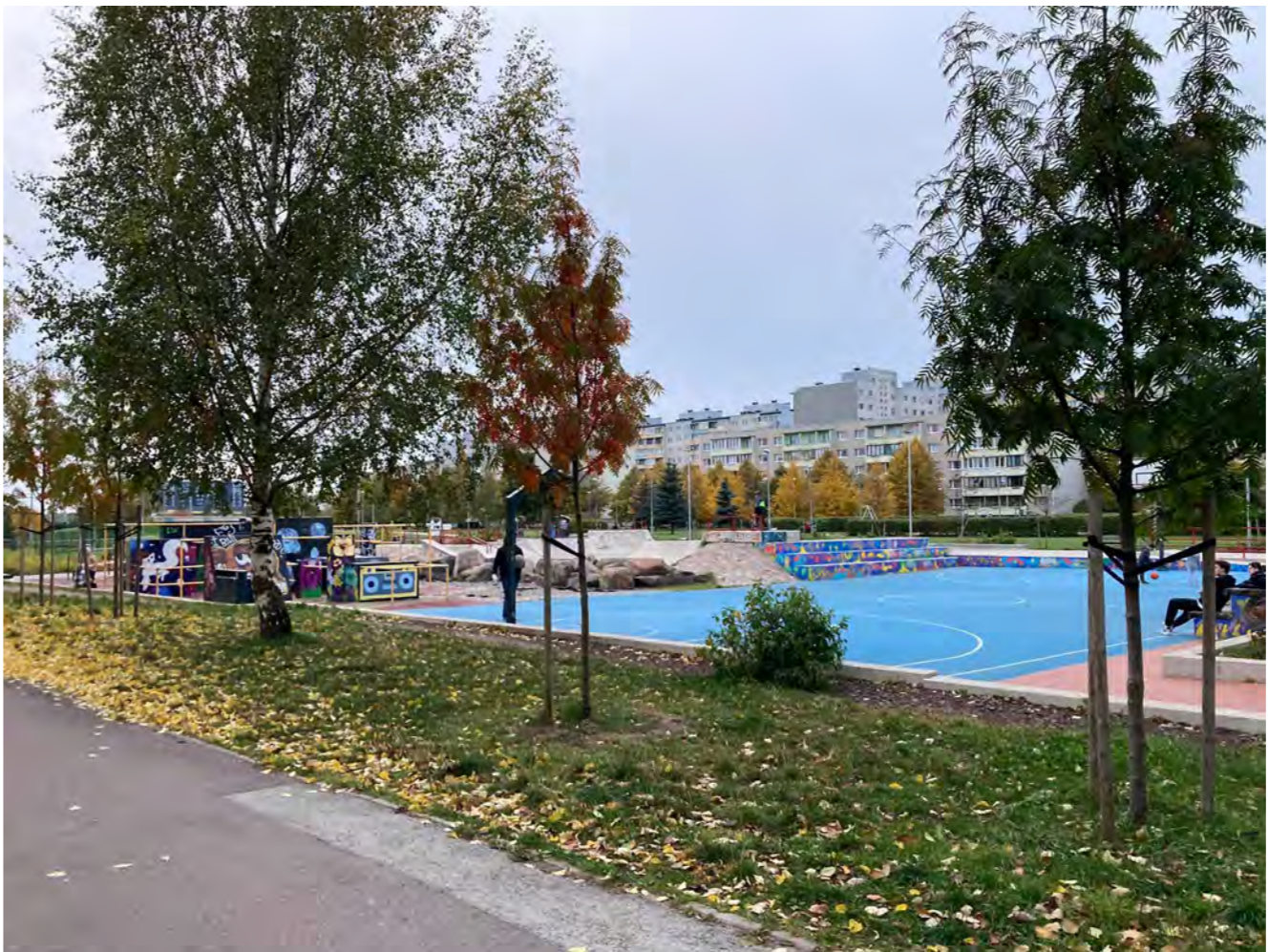
Sídliště v Tallinnu