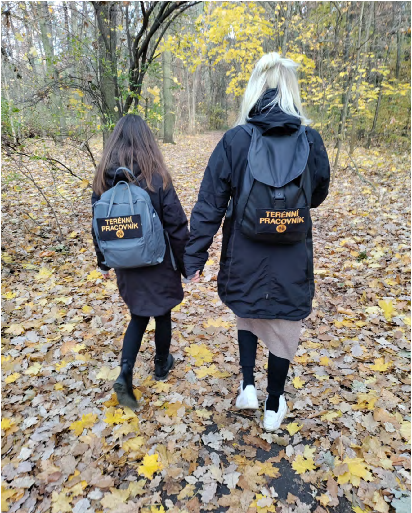
Klub Běcho – Streetwork