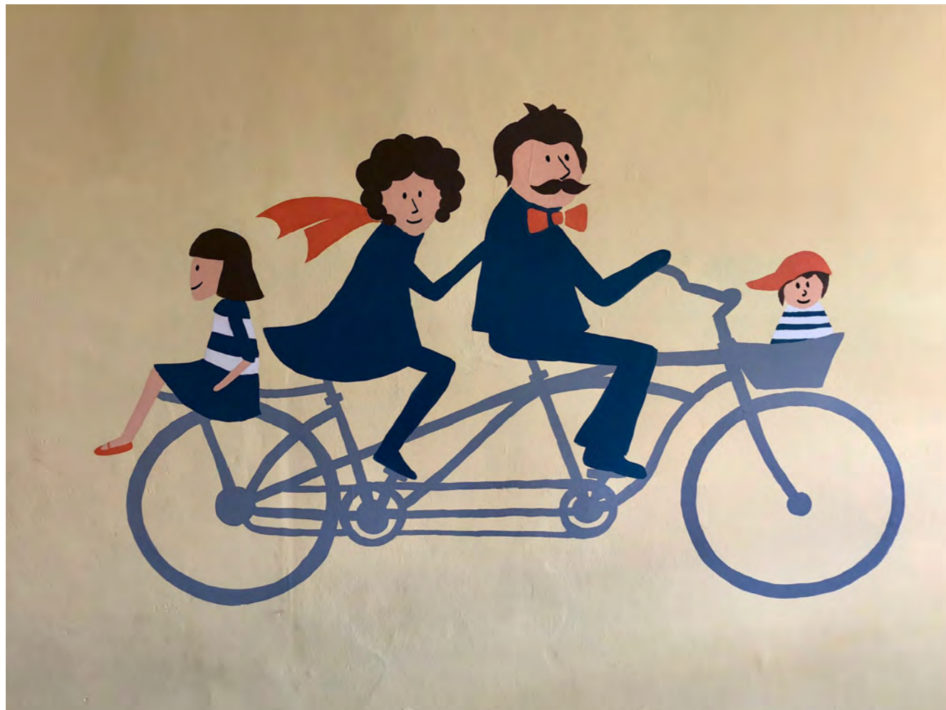
Komunitní centrum Konopná