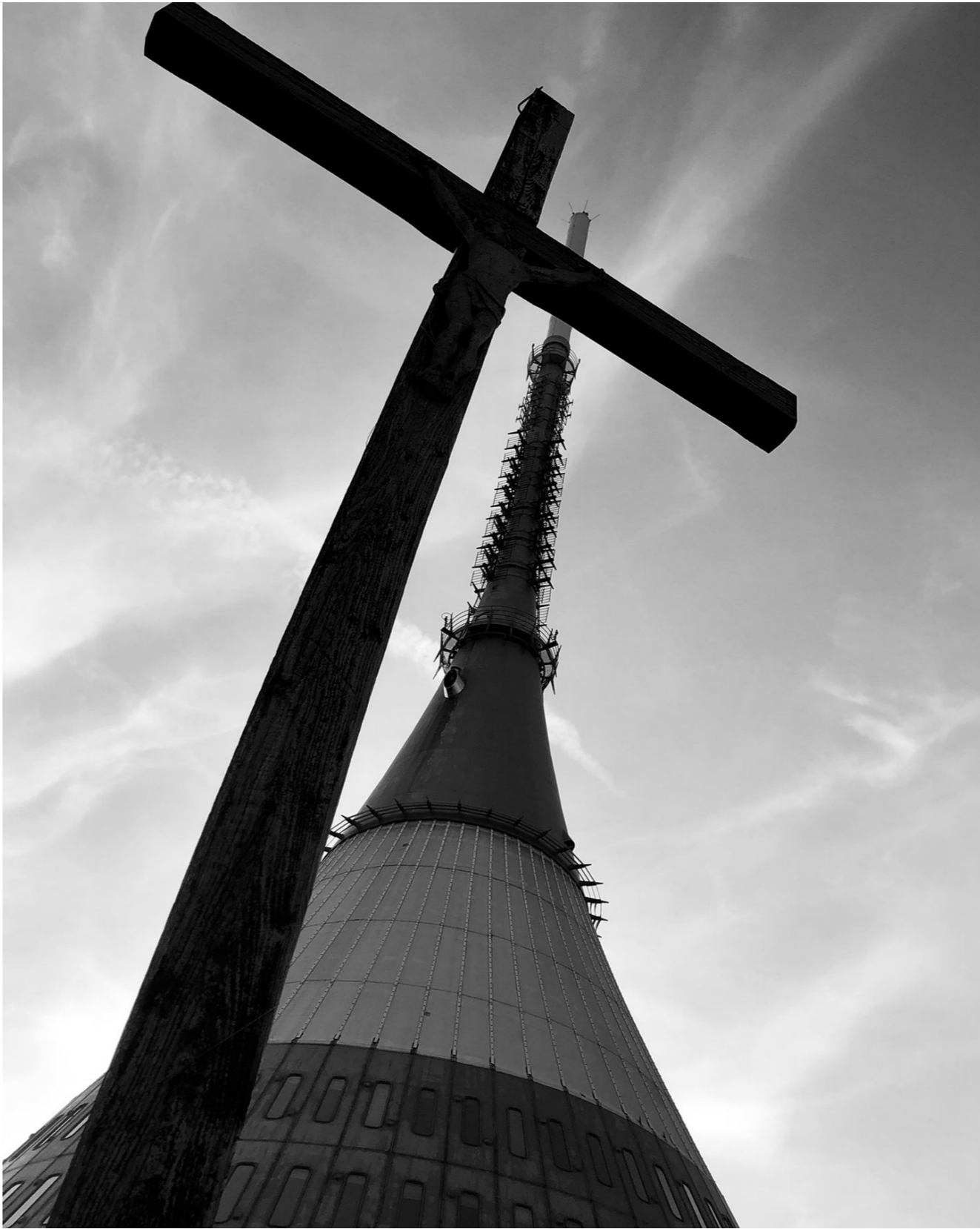
Výlet na Ještěd