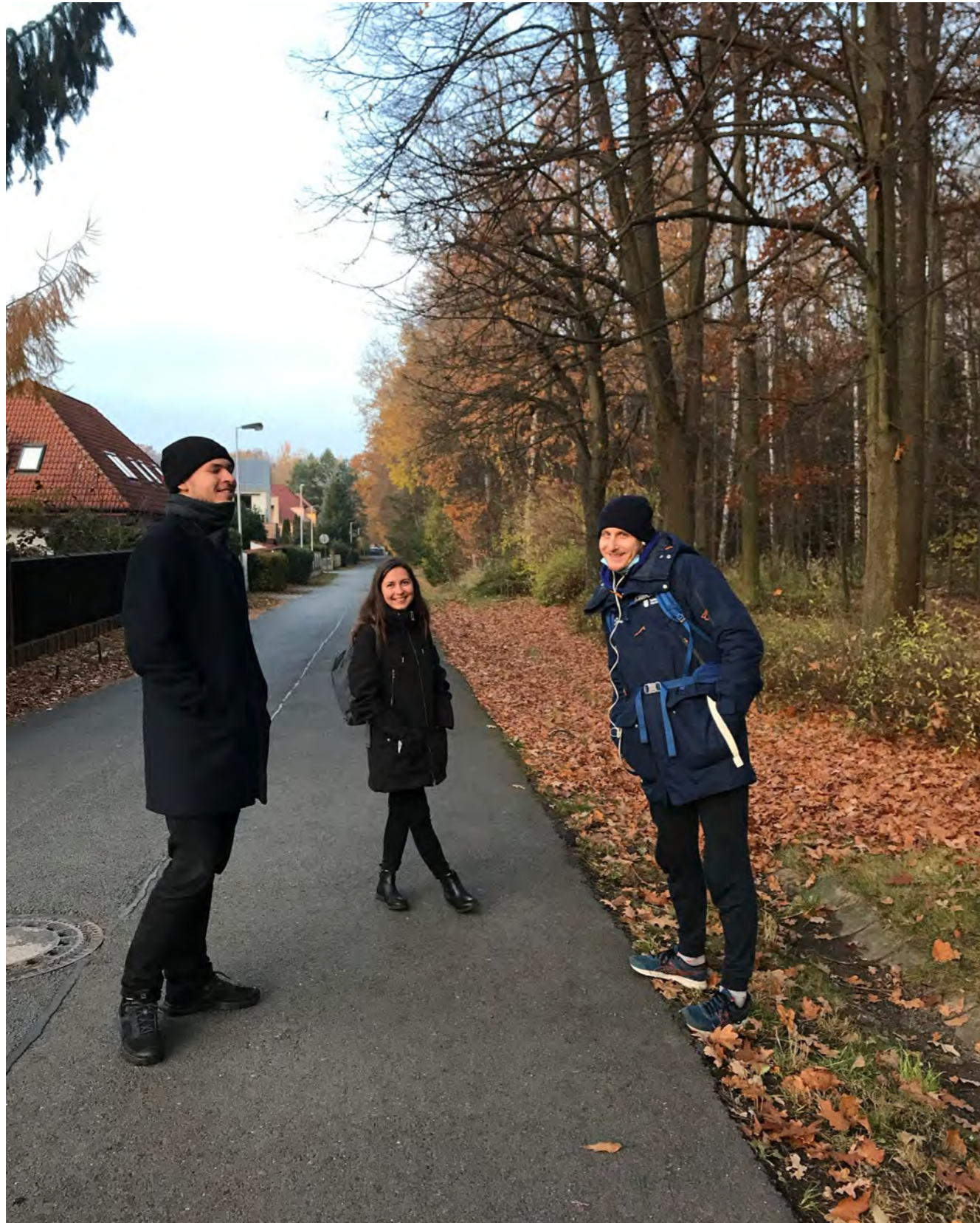
Klub Běcho – Streetwork