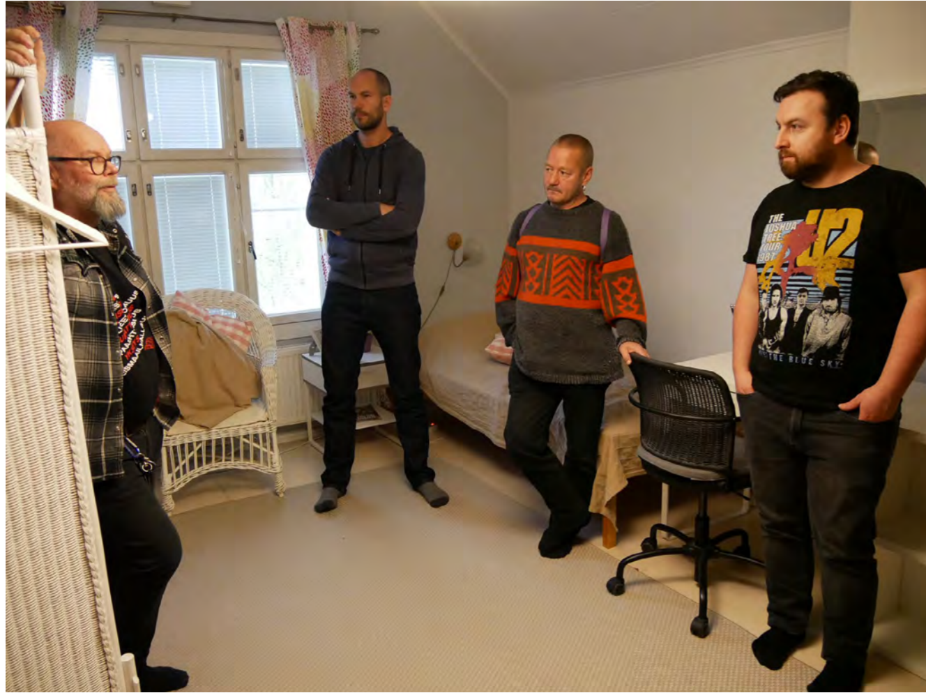
Centrum pro mladistvé ve Vantaa