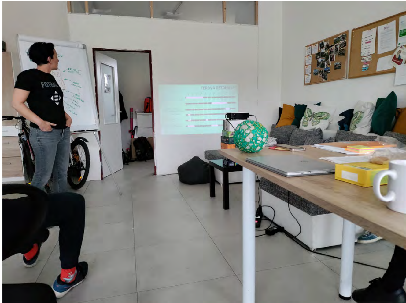
Autobus – Fotbal pro rozvoj