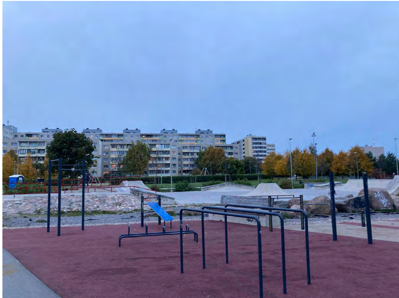
Sídliště v Tallinnu