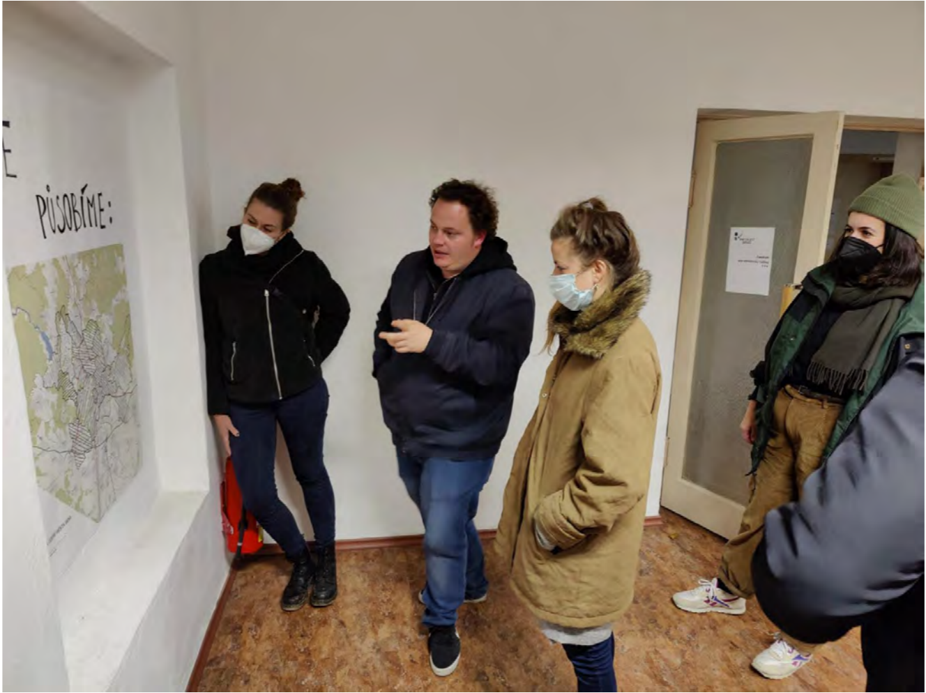
Ratolest Brno – NZDM Likusák