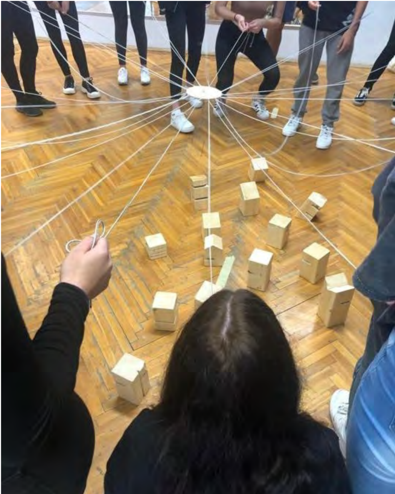
Třídní adaptační program, komunitní centrum Maják