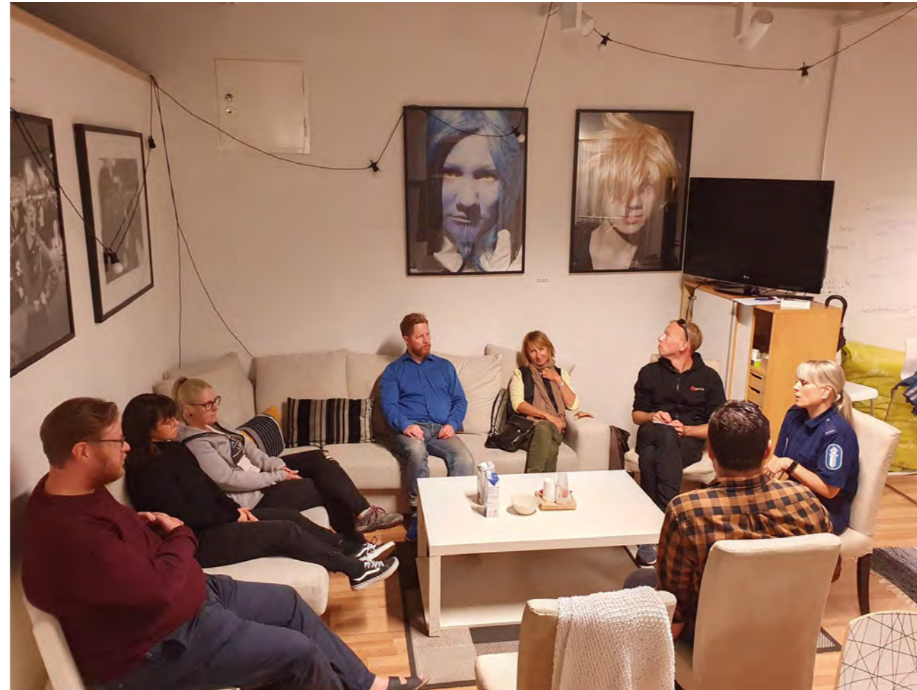
Setkání se zástupkyní policie

Zajímavým zjištěním bylo to, že s návštěvníky a návštěvnicemi neprobíhá žádná registrace ani kontraktování spolupráce, vše funguje na volné bázi.