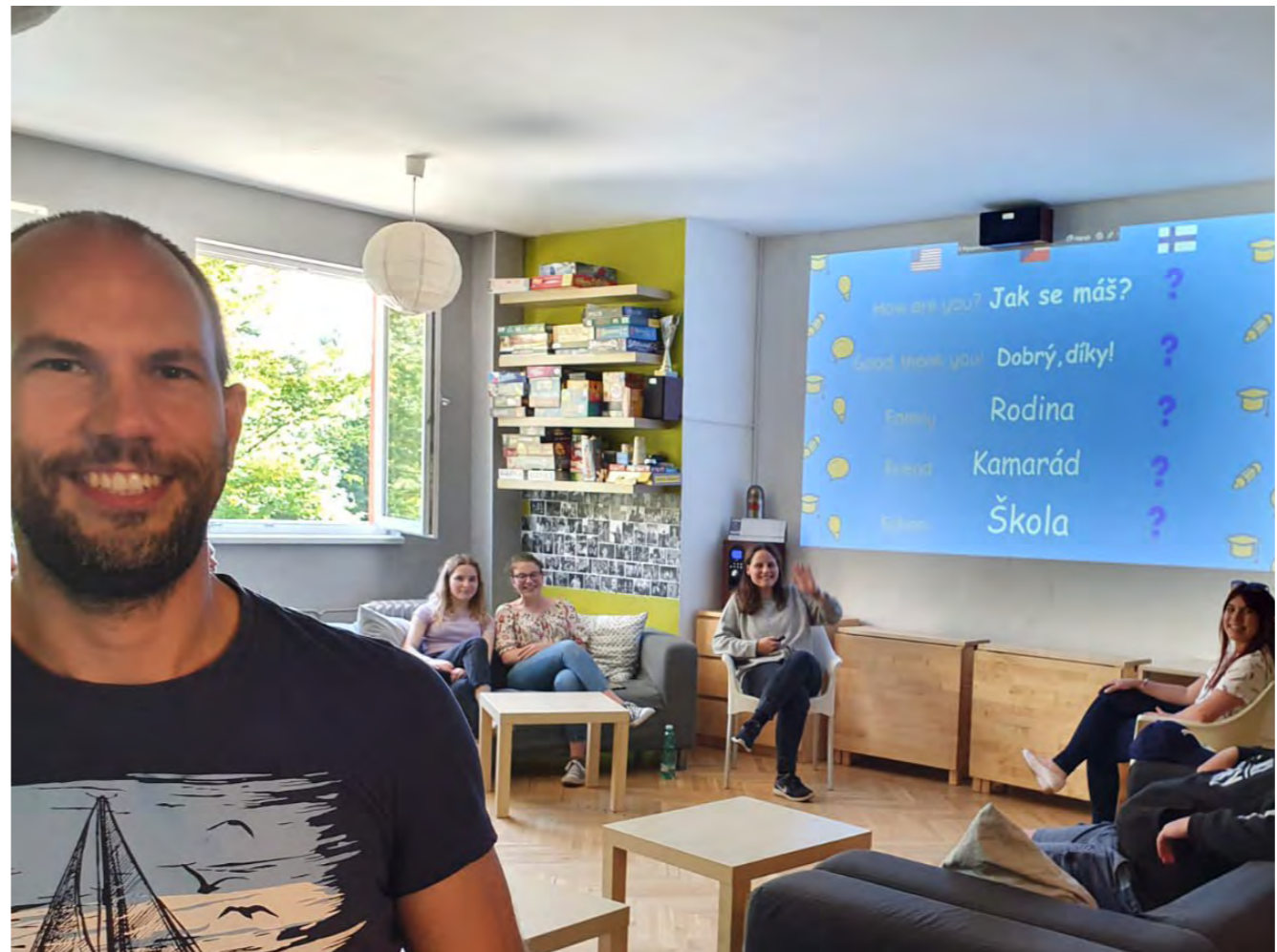
Komunitní centrum Konopná