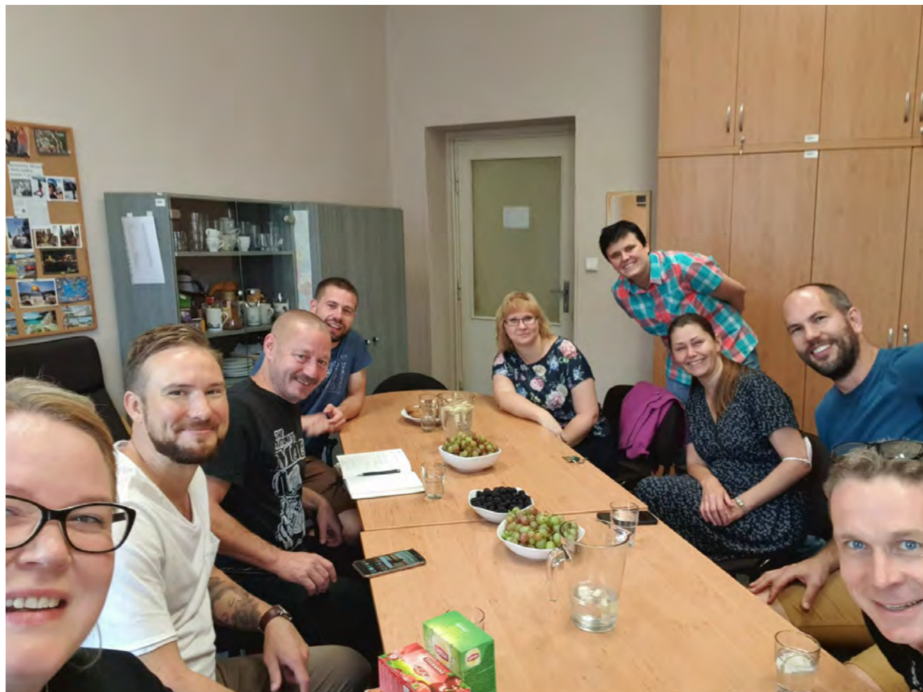
Setkání s pracovníci OSPOD