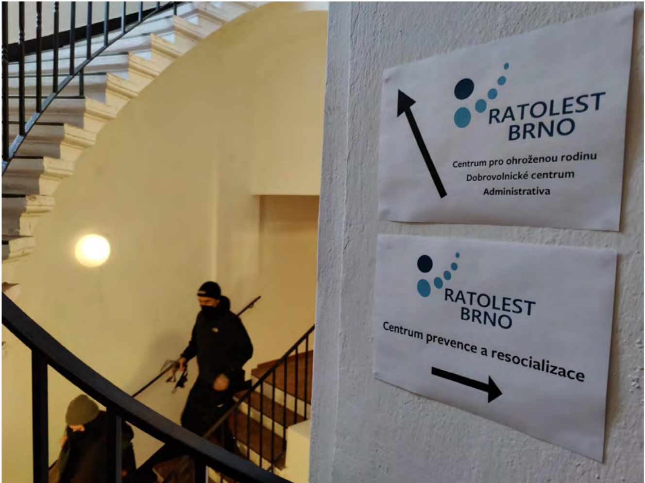
Brno, Centrum prevence a resocializace