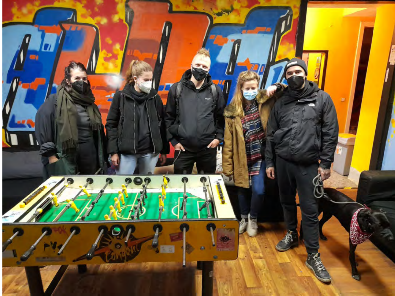
Blansko, PVC Klub