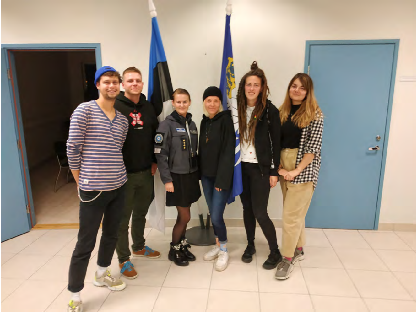
Komunitní policisté v Tallinnu