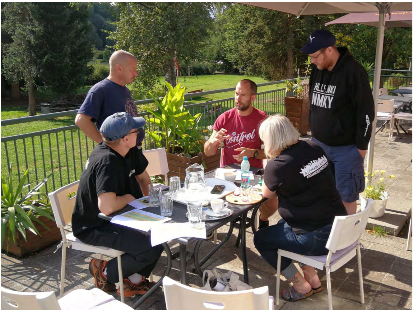
Komunitní centrum Konopná