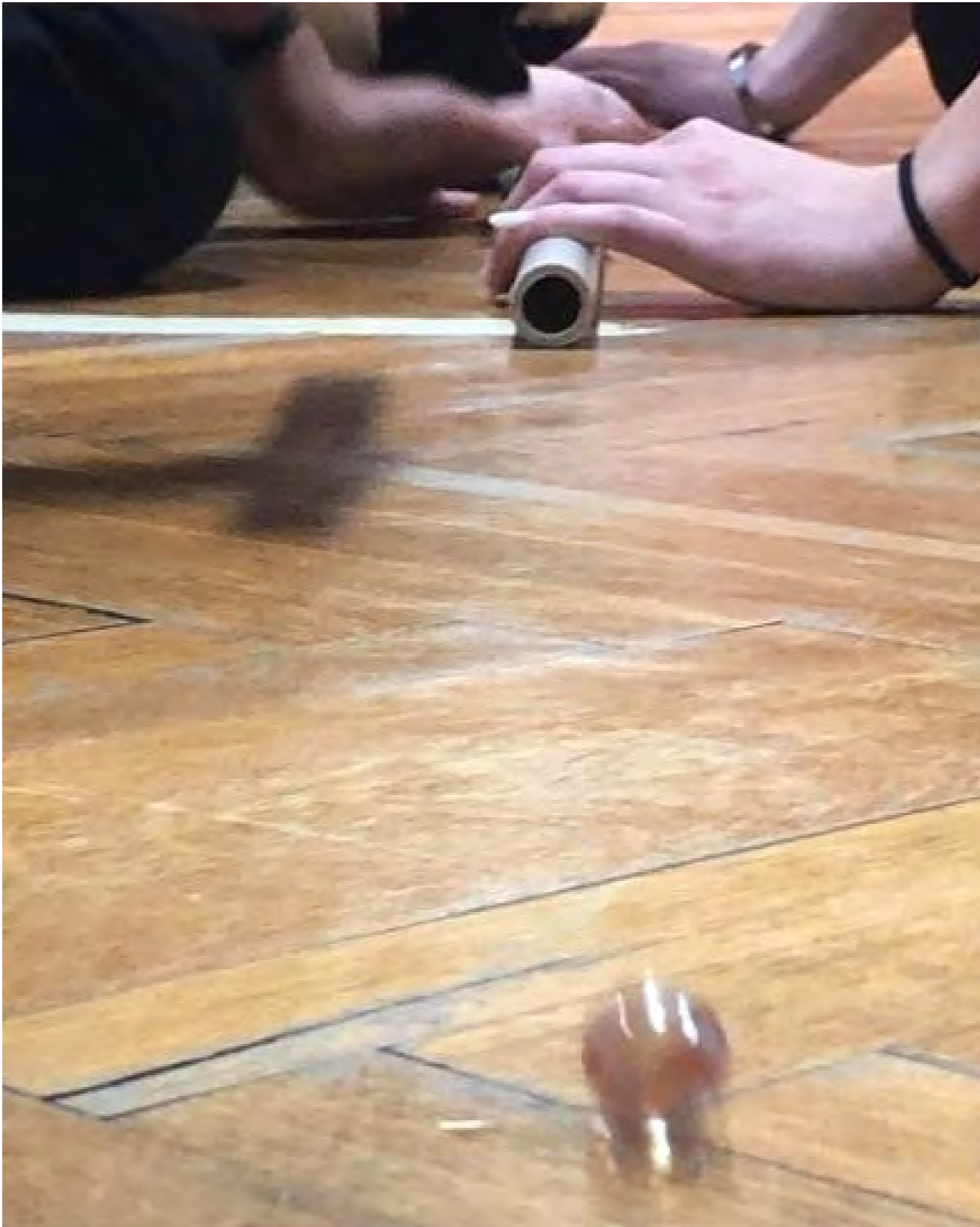
Třídní adaptační program, komunitní centrum Maják