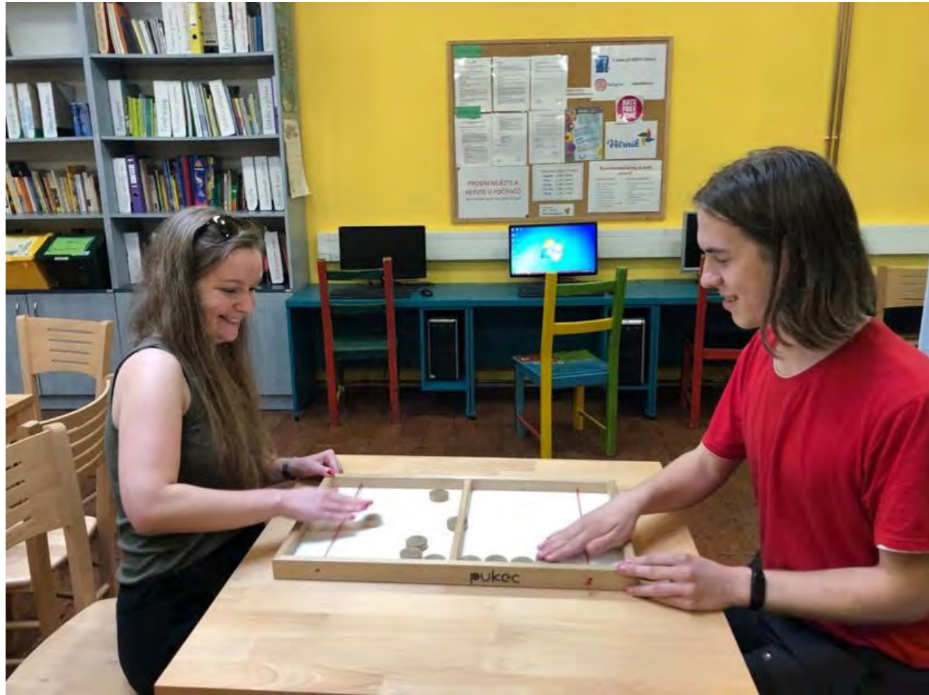
DDM Větrník a V-klub