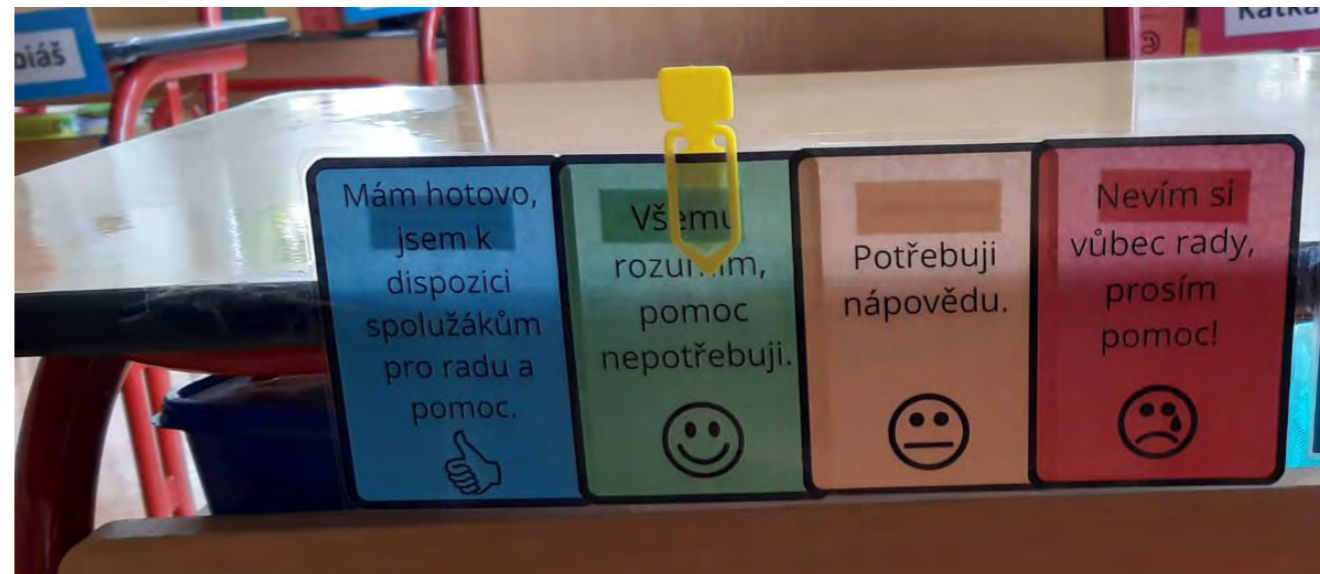
SVČ Narnie, komunitní škola, volnočasové kluby